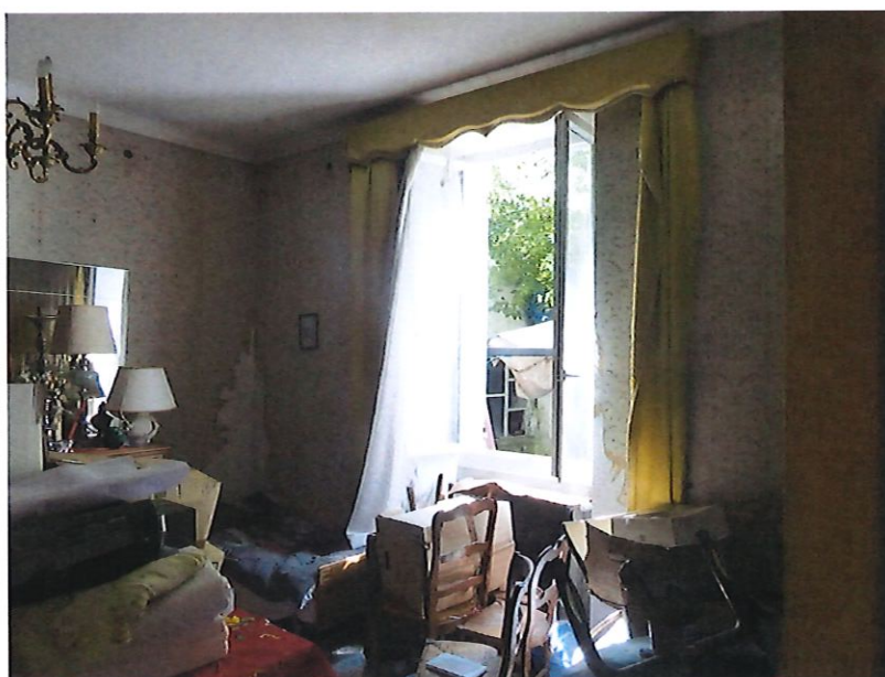
Donnant sur rue, une fenêtre en PVC double vitrage.