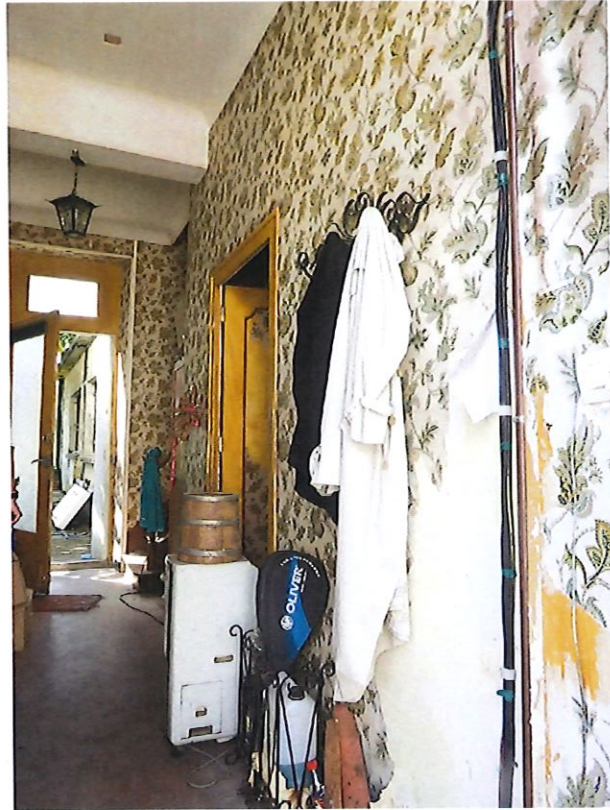
Sol Un ciment ancien teinté.