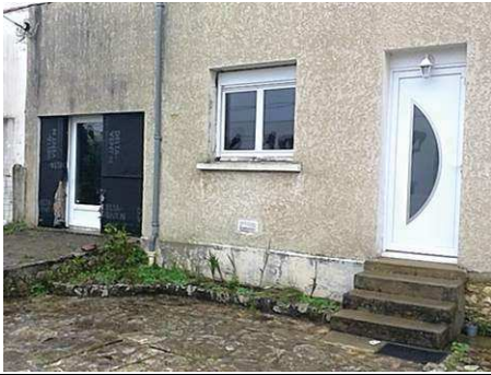
Photo n° PhAss001 Localisation : Eau Pluviales : Description : Gouttière avant/rue : Rejet non retrouvé