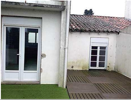
Photo n° PhAss002 Localisation : Eau Pluviales : Description : Gouttière arrière : Rejet non retrouvé

Photo n° PhAss001 Localisation : Eau Pluviales : Description : Gouttière avant/rue : Rejet non retrouvé